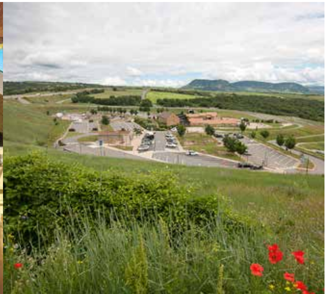
Onder: De Lepelaar en de Aalscholver aan de A6