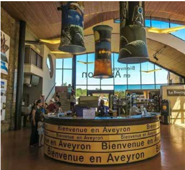
Boven: Millau in Aveyron