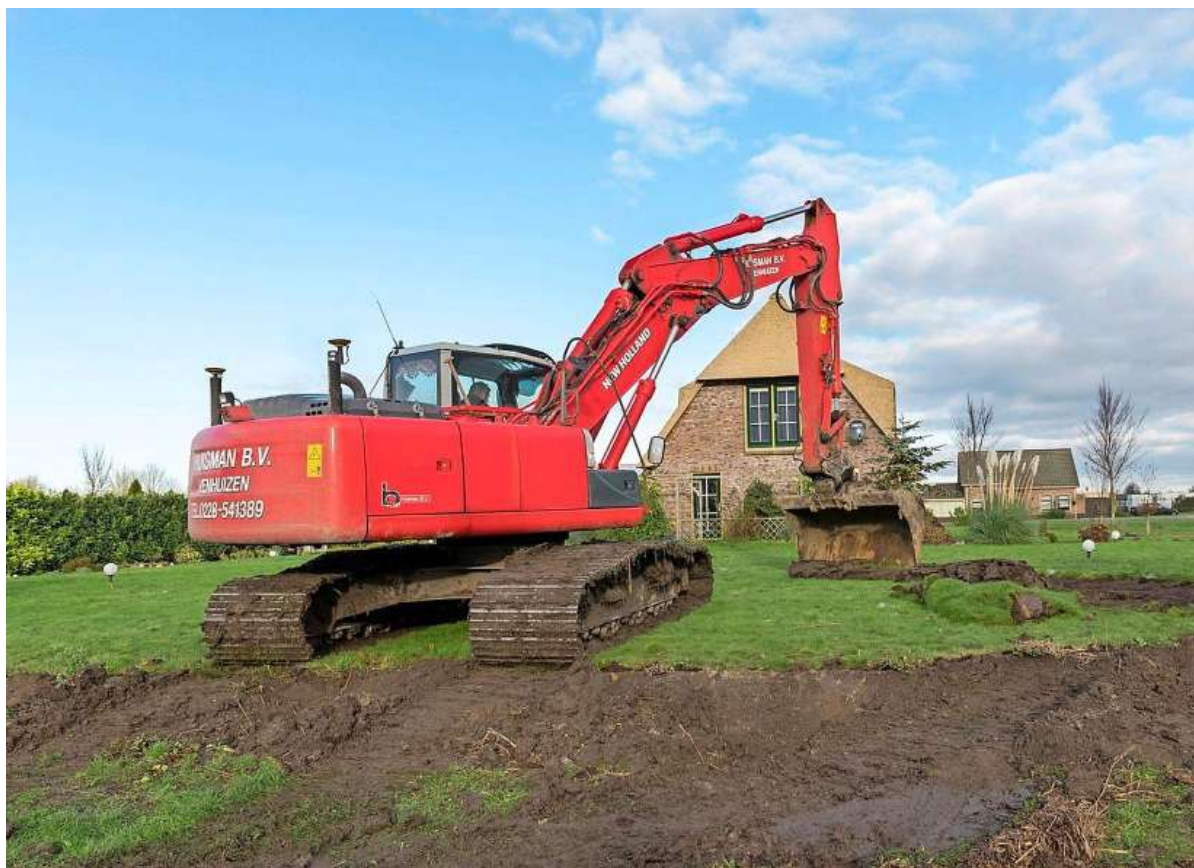
De eerste graafwerkzaamheden zijn begonnen.

Door ruilverkaveling veranderde het mozaïekland van De Drieban, net zoals de meeste andere landbouwgronden in Nederland in de tweede helft van de twintigste eeuw, in akkerlanden met monoculturen. De boeren die eerst verschillende gewassen verbouwden, kozen elk voor